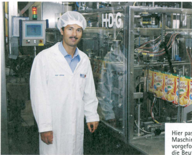
Hier passiert's: Hier entstehen die Maschinen, mit deren Hilfe lose, vorgeformte Knödel ihren Weg in die Beutel finden.